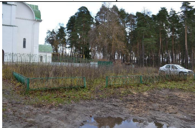
Фотографии территории до реализации инициативного проекта