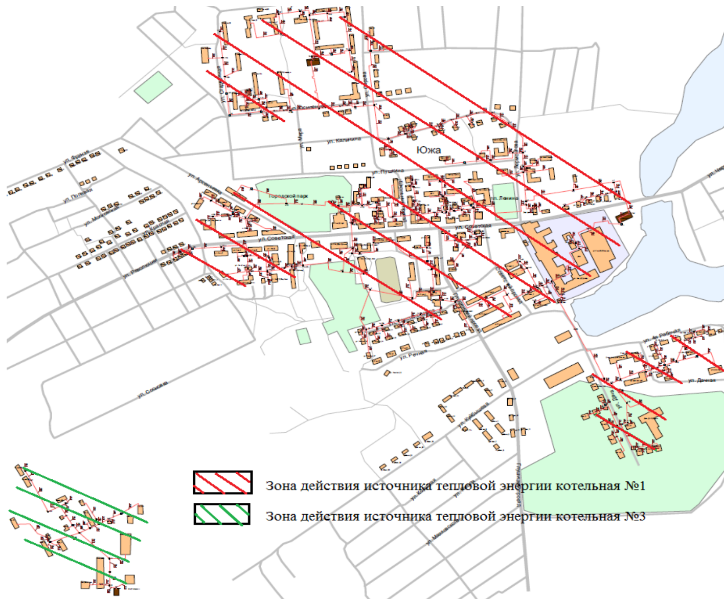
Рисунок 2 – Зоны действия источников теплоснабжения Южского городского поселения